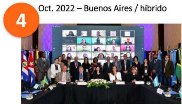
Taller sobre Transición a la formalidad laboral Workshop on Transition to formal employment Oct. 2022 – Buenos Aires / híbrido