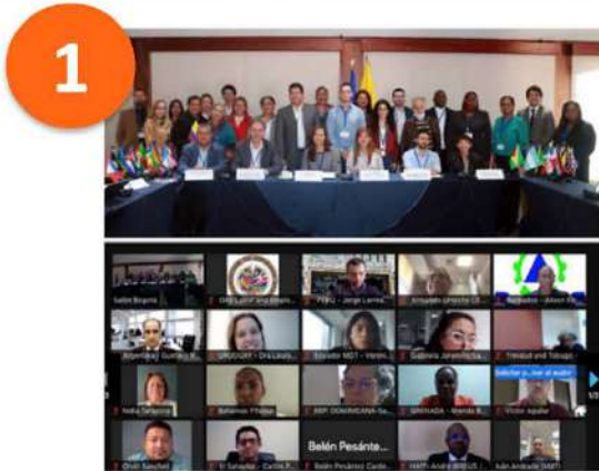
Taller sobre Diálogo Social Workshop on Social Dialogue Jul. 2022 – Bogotá / híbrido

A la fecha: 100% cumplimiento As of today: 100% fulfilled