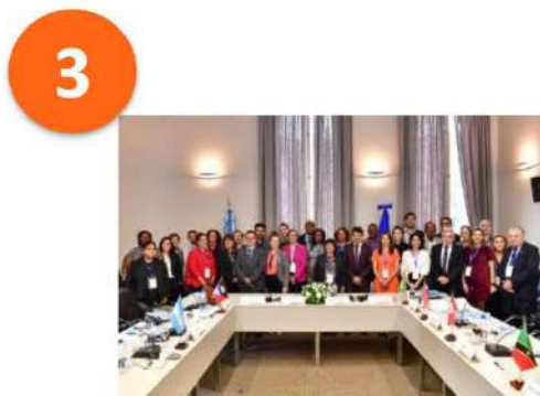
Articulación Educación - Trabajo Education – Labor coordination May. 2023 – Buenos Aires / híbrido

A la fecha: 100% cumplimiento As of today: 100% fulfilled